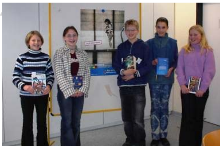
Sieger des Vorlesewettbewerbs